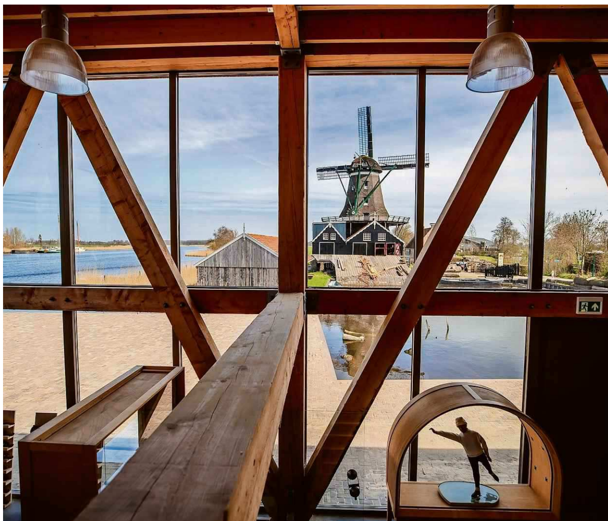
Museum Houtstad IJlst is gemaakt van veel hout en glas en biedt een prachtig uitzicht op Molen de Rat en de Geau.