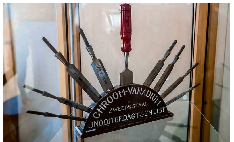
Bij Nooitgedagt werden op het hoogtepunt 1,2 miljoen beitels per jaar gemaakt.