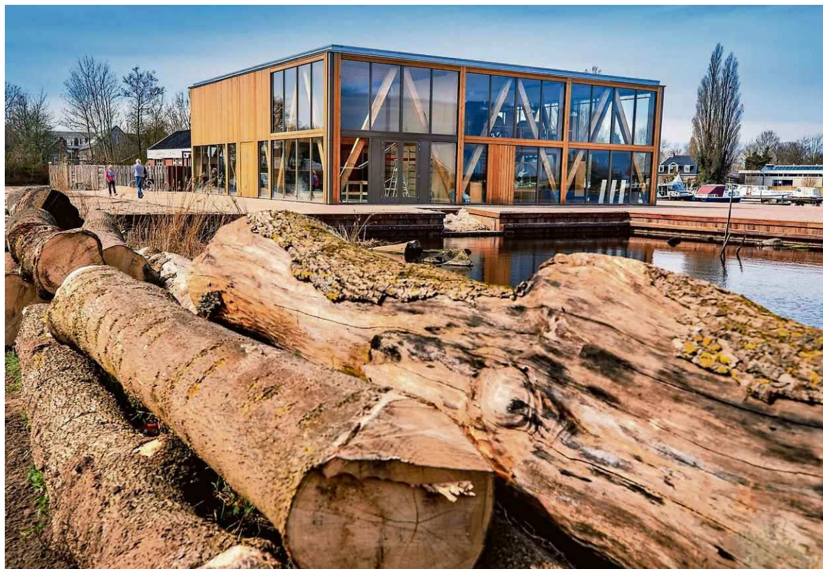
Het nieuwe museum „past bij de sfeer en de historie van IJlst als houtstad”.

Dat het museum op deze locatie is neergestreken komt door een samenloop van omstandigheden.